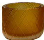
VAB (25) VASO / VASE Ø 20x15H. cm Ø 7 3/4x6H. "